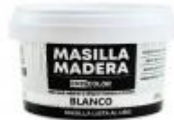
MASILLA MADERA BLANCO 250GR