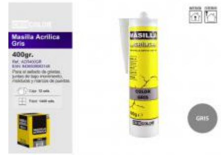
MASILLA ACRILICA GRIS 400GR