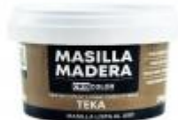
MASILLA MADERA TEKA 250GR