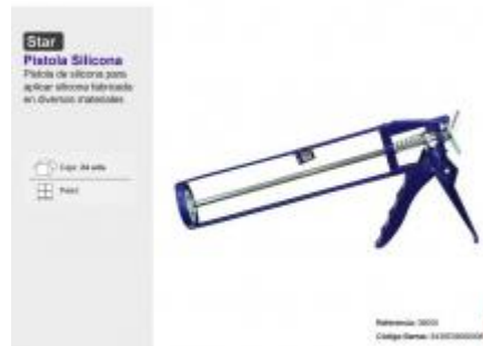
PISTOLA SILICONA STAR