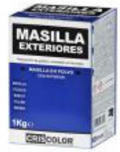
EOBRICO MASILLA EXTERIOR 1 KG