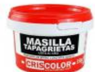
PLASTE TAPAGRIETAS 350GR