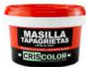
MASILLA TAPAGRIETAS 300 GR