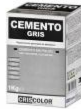
EOBRICO CEMENTO GRIS 1KG