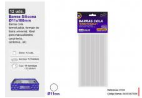
BARRA SILICONA Ø11X180MM. 12UDS.