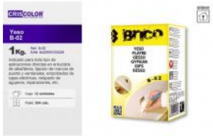
YESO B-02 1KG