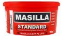
MASILLA STANDARD 750GR.