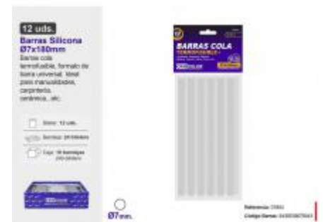
BARRA SILICONA Ø7X180MM. 12UDS.