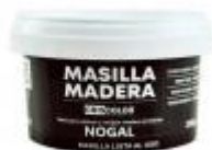
MASILLA MADERA NOGAL 250GR