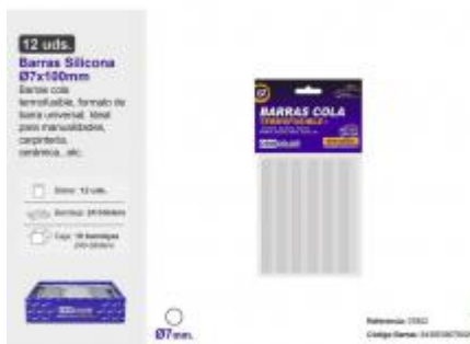
BARRA SILICONA Ø7X100MM. 12UDS.