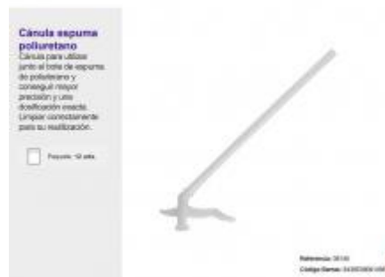
CANULA ESPUMA POLIURETANO