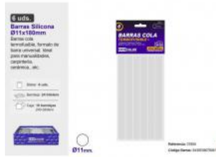
BARRA SILICONA Ø11X180MM. 6UDS.