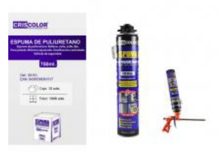
ESPUMA POLIURETANO 750ML.