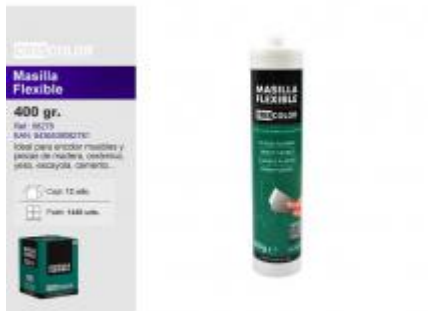
MASILLA FLEXIBLE 400GR