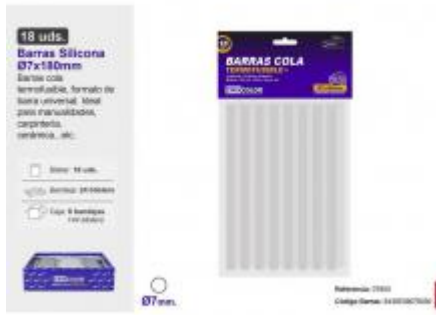
BARRA SILICONA Ø7X180MM. 18UDS.