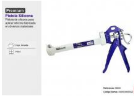
PISTOLA SILICONA PREMIUM