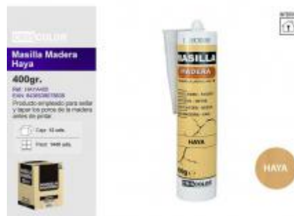
MASILLA MADERA HAYA 400GR