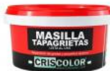
MASILLA TAPAGRIETAS 700GR.