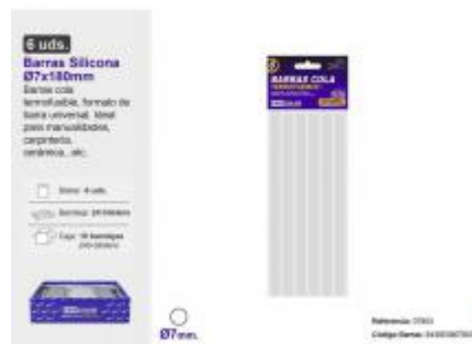
BARRA SILICONA Ø7X180MM. 6UDS.