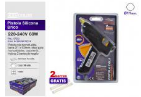
PISTOLA SILICONA BRICO