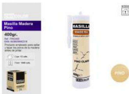
MASILLA MADERA PINO 400GR.