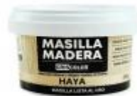
MASILLA MADERA HAYA 250GR