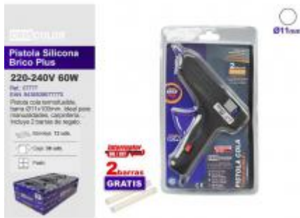
PISTOLA SILICONA BRICO PLUS INTERRUPTOR