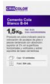
CEMENTO COLA B-04 1,5KG