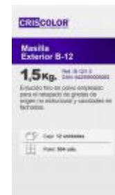
MASILLA EXTERIOR B-12 1,5KG