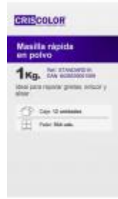
MASILLA STANDARD 1KG.