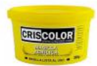
MASILLA ACRILICA 300GR