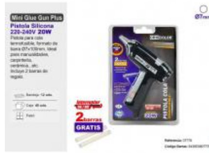
PISTOLA SILICONA MINI GLUE GUN PLUS INTERRUPTOR