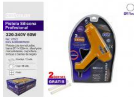
PISTOLA SILICONA PROFESIONAL