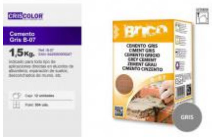
CEMENTO GRIS B-07 1,5K