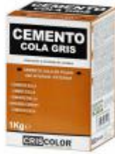
EOBRICO CEMENTO COLA GRIS 1KG