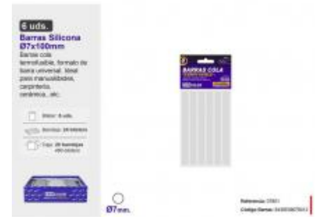
BARRA SILICONA Ø7X100MM. 6UDS.