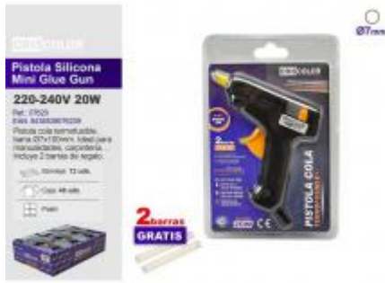
PISTOLA SILICONA MINI GLUE GUN