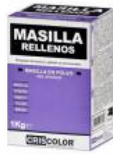
EOBRICO MASILLA RELLENO 1KG