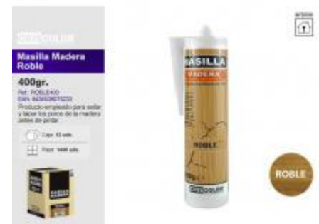
MASILLA MADERA ROBLE 400GR.