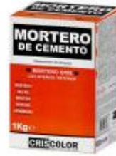
EOBRICO MORTERO DE CEMENTO 1KG