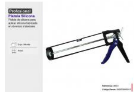
PISTOLA SILICONA PROFESIONAL