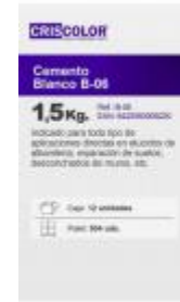
CEMENTO BLANCO B-06 1,5KG