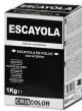
EOBRICO ESCAYOLA 1KG