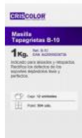
MASILLA TAPAGRIETAS B-10 1KG