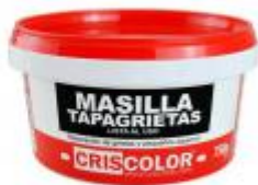
PLASTE TAPAGRIETAS 750GR.