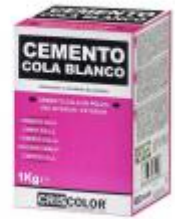
EOBRICO CEMENTO COLA BLANCO 1KG