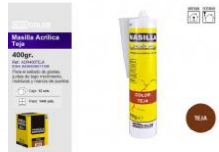
MASILLA ACRILICA TEJA 400GR