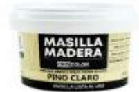
MASILLA MADERA PINO 250GR