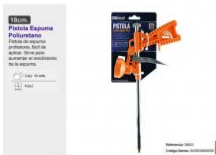
PISTOLA ESPUMA POLIURETANO