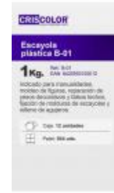
ESCAYO LA PLASTICA B-01 1KG