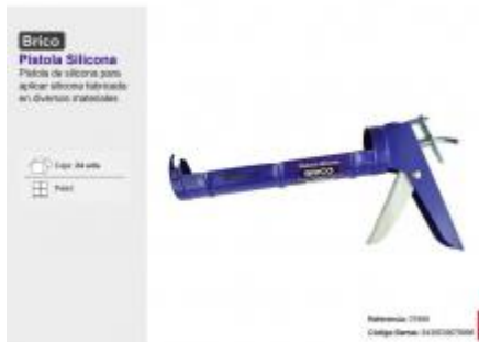
PISTOLA SILICONA BRICO