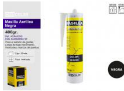
MASILLA ACRILICA NEGRA 400GR.