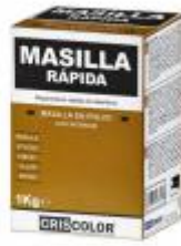
EOBRICO MASILLA RAPIDA 1KG