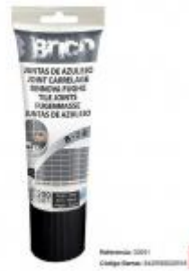
MASILLA JUNTAS AZULEJO 200GR NG