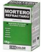
EOBRICO MORTERO REFRACTARIO