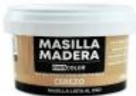
MASILLA MADERA CEREZO 250GR