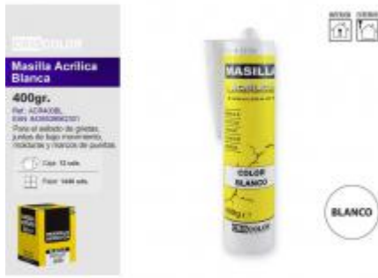
MASILLA ACRILICA BLANCA 400GR.