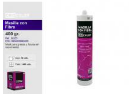
MASILLA CON FIBRA 400GR.