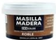
MASILLA MADERA ROBLE 250GR